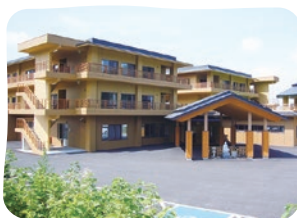
特別養護老人ホーム ひがしざわ