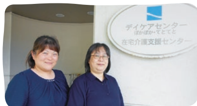
在宅介護支援センター