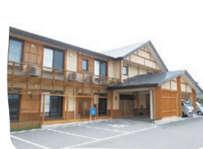
地域密着型特別養護老人ホーム むらやま