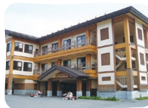
特別養護老人ホーム おばなざわ