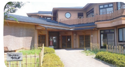
認知症高齢者グループホーム グループホームさくらんぼ