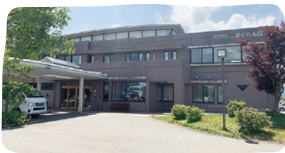
介護老人保健施設 ナーシングホームさくらんぼ