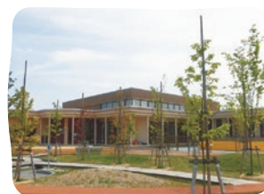
認定こども園 おだしま