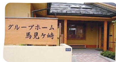
ケアタウン馬見ヶ崎