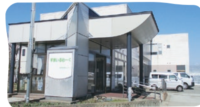
就労支援センター すまいるわーく