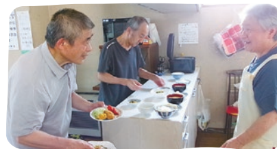
共同生活援助事業所 ねまりや